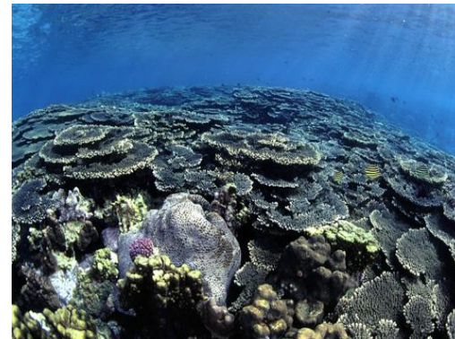
串本のサンゴいっぱいビーチ