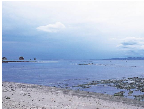
白浜のおだやかなビーチ